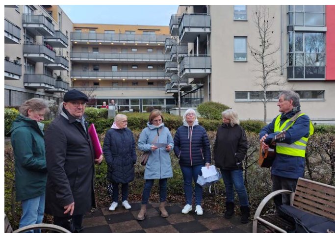
Im Innenhof des AWO Seniorenzentrums

Es ist immer wieder erstaunlich zu erfahren, wieviel Leid Menschen ertragen müssen, welches oft im Verborgenen auch in Wanheimerort stattfindet.