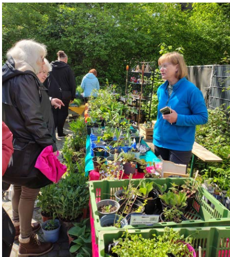
Regen Andrang überall

Bei allerschönstem Wetter fand unser Pflanzenflohmarkt am 25. April am Gemeindehaus Vogelsangplatz statt.