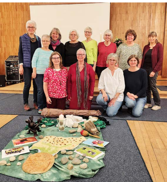
Das Team

Weltweit feierten wir mit Christinnen aus Nigeria den Weltgebetstag: "Kommt und bringt Eure Last!"