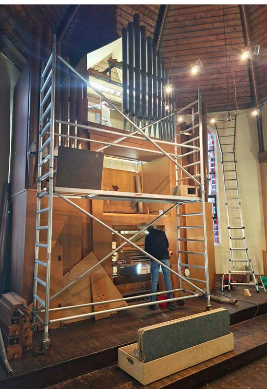
Renovierung der Orgel

Die Orgel unserer schönen Wanheimer Kirche wurde nach aufwändigen Sanierungsarbeiten (siehe Bild) wieder in Betrieb genommen.